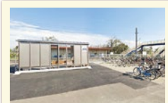
JR府中駅 まで自転車で12分 (2400m)