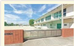
南井上小学校 まで徒歩5分 (350m)