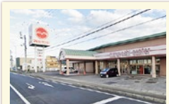
マルヨシセンター まで車で6分 (2400m)