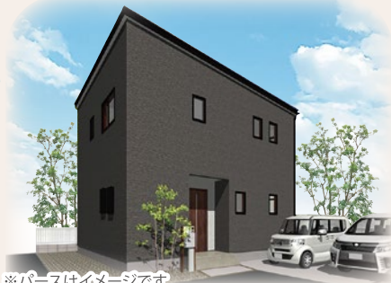
※パースはイメージです ■土地面積/170.21㎡ (51.48坪) ■延床面積/99.37㎡ (30.05坪)