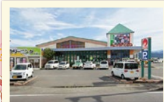
マルナカ まで車で7分 (2600m)