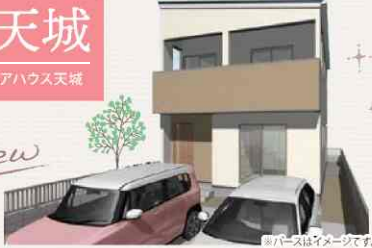
※パースはイメージです。